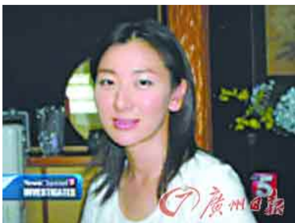
萨瓦的日籍前妻法子。

日前，一名美国男子为了追回被前妻非法带走的年幼子女，漂洋过海孤身前往日本，可是却因为诱拐未成年人的罪名而被日本警方逮捕。