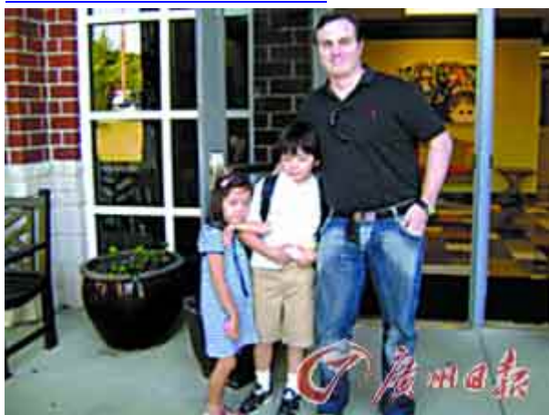
萨瓦和他前妻的两个孩子。